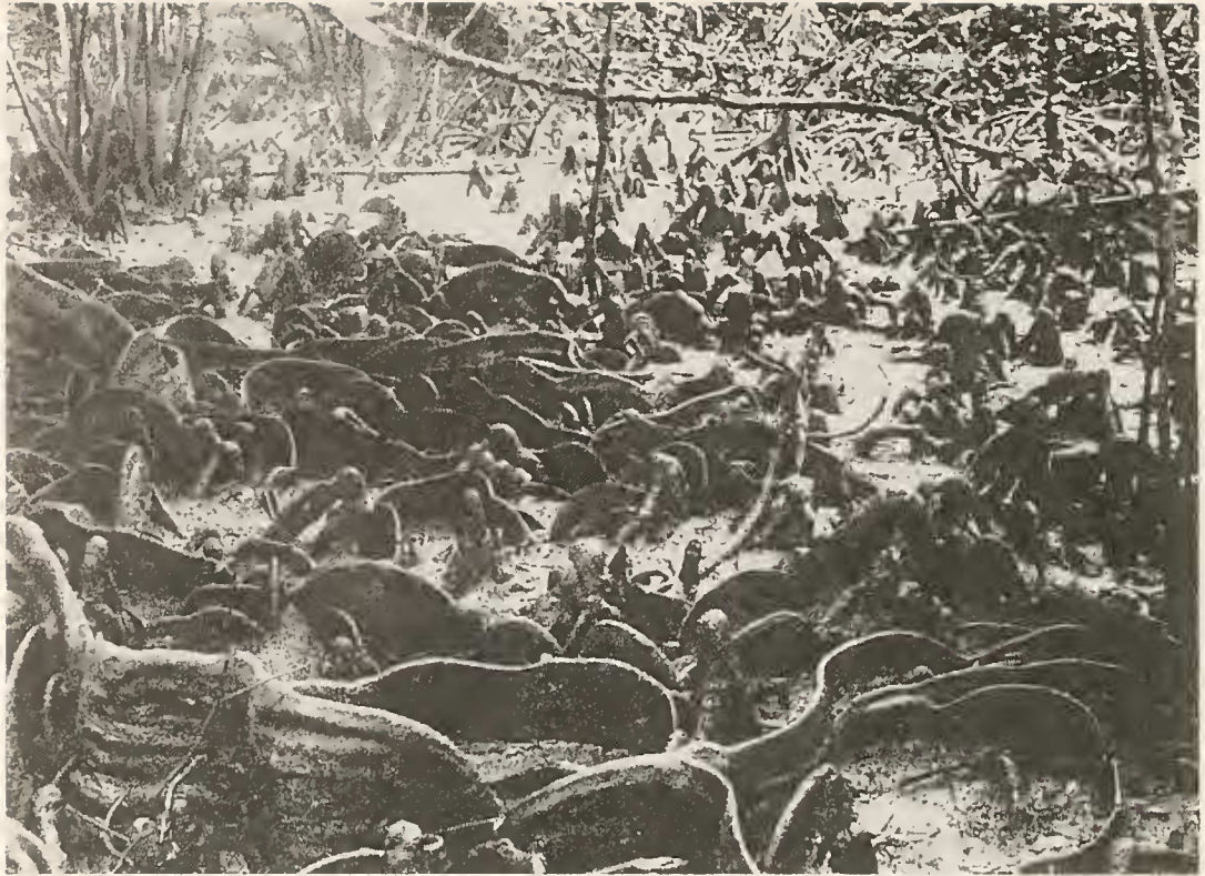
Abb. 10. Biotop der Mangrove Xylocarpus moluccensis , senu Carapa xylocarpoides . Die schlangenartig gewundenen Brettwurzeln gehören zu Xylocarpus moluccensis , die Pneumatophoren im Hintergrund stammen von der Mangrove Bruguiera gymnorrhiza .

an der Grenze zum beginnenden Regenwald. Die Wurzeln der „Festland-Mangrove“ werden oft nur bei hohen Fluten vom Wasser überspült.